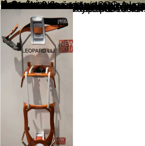
Petzl Leopard - mačky s provázkem